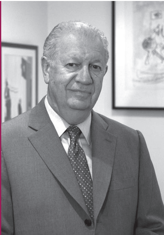
© RICARDO LAGOS Ex Presidente de la República y Enviado Especial para el Cambio Climático de la ONU.

El ex Presidente y la crisis climática mundial: